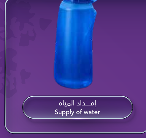
إمداد المياه Supply of water