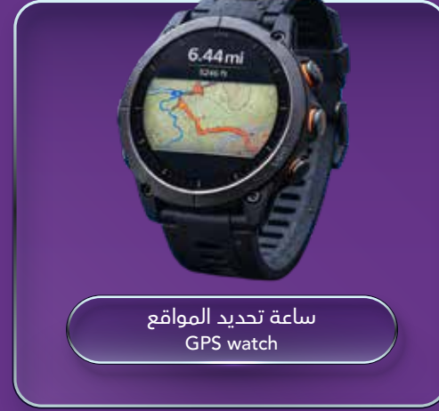
ساعة تحديد المواقع GPS watch