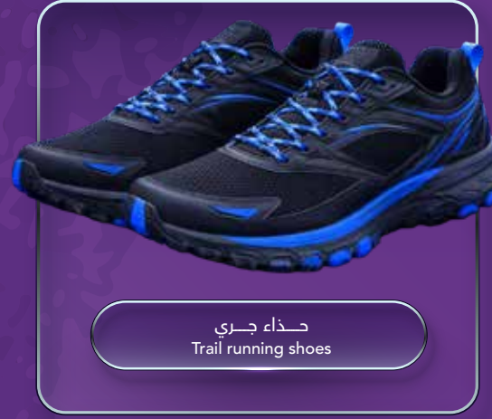
حذاء جري Trail running shoes