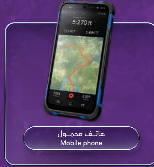
هاتف محمول Mobile phone