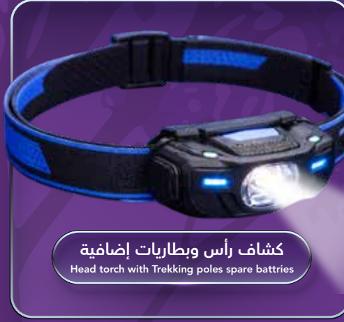
كشاف رأس وبطاريات إضافية Head torch with Trekking poles spare batteries