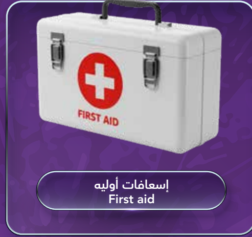
إسعافات أولية First aid