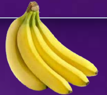
سناكس (موز) Snacks (Banans)