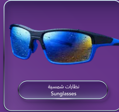
نظارات شمسية Sunglasses