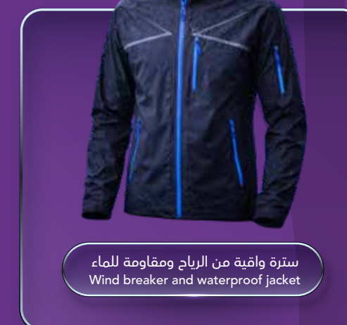
سترة واقية من الرياح ومقاومة للماء Wind breaker and waterproof jacket