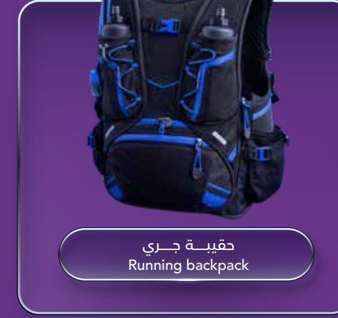
حقيبة جري Running backpack