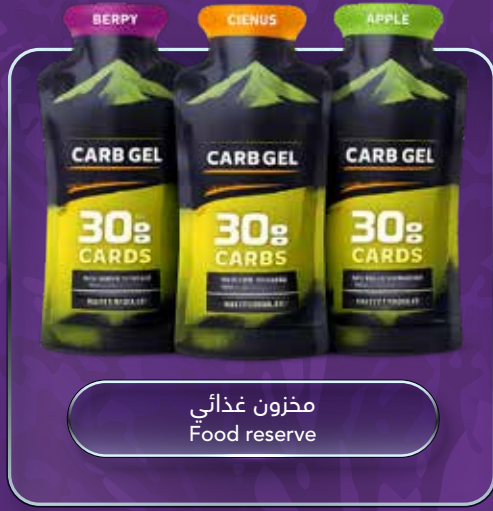
مخزون غذائي Food reserve