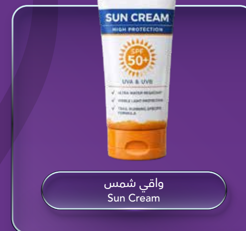
واقي شمس Sun Cream